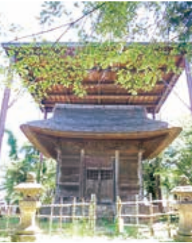
蒲生秀行廟（館馬町）