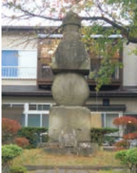
三代蒲生忠郷の墓(高蔵寺北)