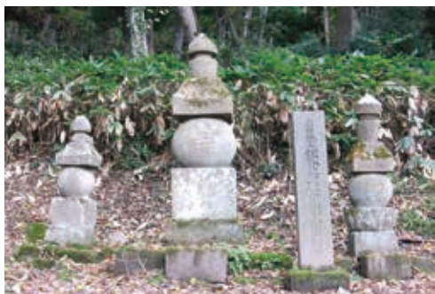
松倉重頼主従の墓(会津若松市建福寺前)

島原城主松倉重政の弟で次の城主になるはずだった松倉重頼ですが、1637(寛永14)年10月に起きた島原・天草の乱の責任を問われ、幕府の命で追放されました。重頼の身柄を預かったのが会津藩主保科正之でした。正之は丁重に処遇していました