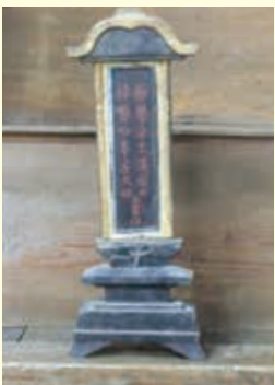
猪俣善左衛門 夫婦の位牌