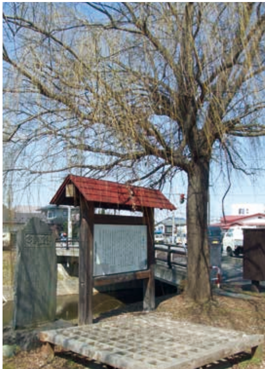
湯川に架かる「涙橋」