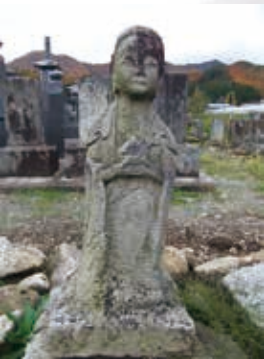
集落の墓地にある観音像

栗生沢は村人の多くがキリシタンだったといわれています。マリア観音と目される観音像は高さ約70cmで両手に如意輪のようなものを持っています。腹部に5つの穴が十字形に配列されていますが、十字を表現したものとも考えられます。