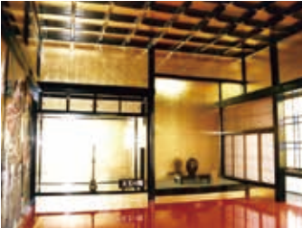
旧レオ氏郷南蛮館内に再現した天主の間(想像)

鶴ヶ城に保管され、現在はサントリー美術館と神戸市立博物館に収蔵されている「泰西王侯騎馬図屏風」や仙台市博物館にある「悲しみのマリア像」です。