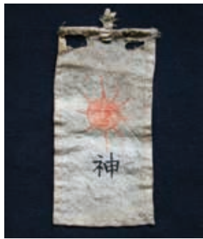
谷野家に伝わるキリシタン遺品の旗

帰農した際、表向きは棄教したとも考えられます。会津若松市町北町上荒久田の谷野家屋敷跡に「天子神社」が建っています。