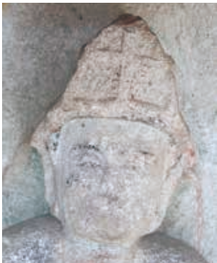
常楽院のマリア観音

額に十字が彫られています。建前上は子安観音として信仰されてきました。常楽院のすぐ近くに明治初期に建てられた教会があります。明治以降、会津のキリスト教布教がどこよりも早かつたのは、会津に内在する芯の強さと反骨心、あるいはやさしさといった気風が脈々と流れているからでしょうか。