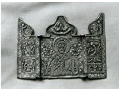
南会津地方で発見されたイコン