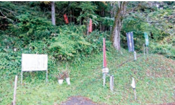
久保田三十三観音の入口