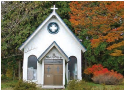
早くも明治初期に建てられた教会