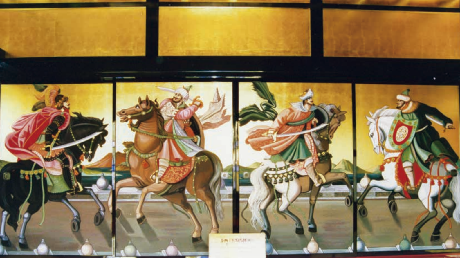
旧レオ氏郷南蛮館にあった「泰西王侯騎馬図」屏風（レプリカ）