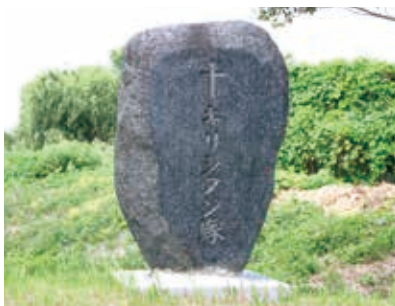
「キリシタン塚」は神指町黒川に架かる涙橋の北、湯川辺りにある

た。薬師堂河原の刑場跡に「キリシタン塚」が立っています。「キリシタン塚」の南、湯川に架かる橋を柳橋、別名「涙橋」ともいいます。罪人が刑場に連行されるときに、この橋が家族との最後の別れになるからです。