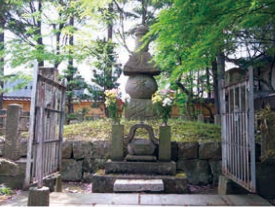
興徳寺にある蒲生氏郷の墓

※「転切支丹本人」のほかに親が棄教した場合、未成人子供を「転切支丹本人」と称した。転切支丹類とは本人、子、孫、曾孫、玄孫までをいう。江戸時代はそれだけキリシタンに厳しかった。檀家制度は江戸幕府のキリシタンを取り締まるために制定された宗教統制策ともいわれる。